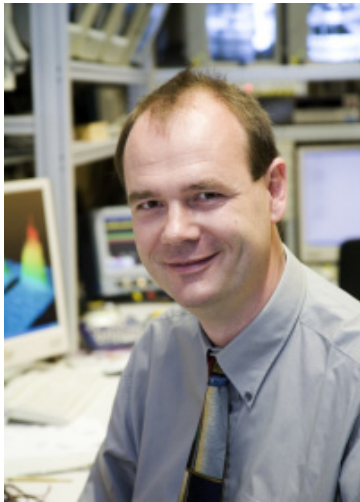
Rudolf Grimm, IQOQI

Einen Meilenstein in der Erforschung von Quantengasmischungen haben Forscher des Instituts für Quantenoptik und Quanteninformation (IQOQI) in Innsbruck erreicht. Der Gruppe um Rudolf Grimm und Florian Schreck gelang es erstmals, in einem Quantengas zwischen zwei fermionischen Elementen, Lithium-6 und Kalium-40, eine starke Wechselwirkung kontrolliert herzustellen. Ein solches Modellsystem verspricht nicht nur neue Einsichten in die Festkörperphysik, sondern zeigt auch verblüffende Analogien zur Urmaterie kurz nach dem Big Bang.